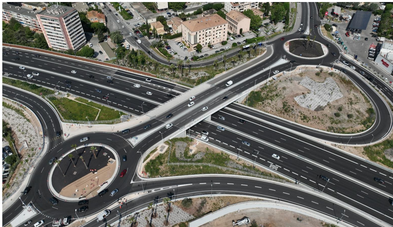
A57 - Échangeur de Tombadou

VINCI Autoroutes réalisera des travaux sur les équipements de l'autoroute A50, ceux du tunnel de Toulon et poursuivra l'élargissement de l'autoroute A57 avec des opérations complexes et techniques de nuit, la semaine prochaine. Afin de garantir la sécurité des équipes et des usagers, ces interventions nécessiteront des modifications de circulation dans le tunnel de Toulon ainsi que sur les autoroutes A50 et A57. Pour limiter la gêne au trafic, les opérations auront lieu de nuit, en semaine, du lundi 26 mai au mercredi 28 mai 2025, entre 21h et 6h.