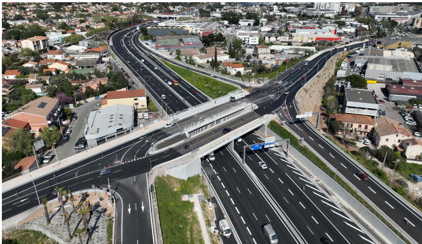
A57 – Pont des Fourches – Mars 2025

VINCI Autoroutes réalisera des travaux sur les équipements de l'autoroute A50, ceux du tunnel de Toulon et poursuivra l'élargissement de l'autoroute A57 avec des opérations complexes et techniques de nuit, la semaine prochaine. Afin de garantir la sécurité des équipes et des usagers, ces interventions nécessiteront des modifications de circulation dans le tunnel de Toulon ainsi que sur les autoroutes A50 et A57. Pour limiter la gêne au trafic, les opérations auront lieu de nuit, en semaine, du lundi 28 avril au vendredi 2 mai 2025, entre 21h et 6h.