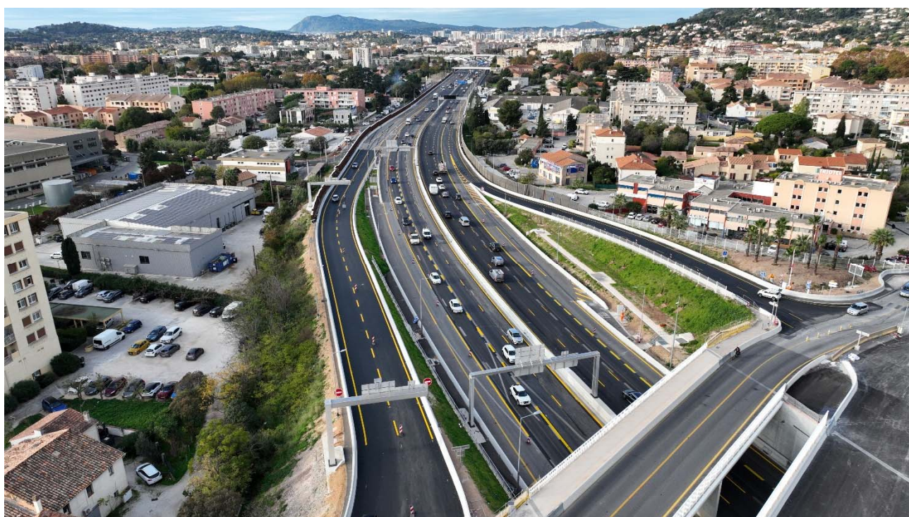
Secteur de La Valette Sud (n°4) / Les Fourches