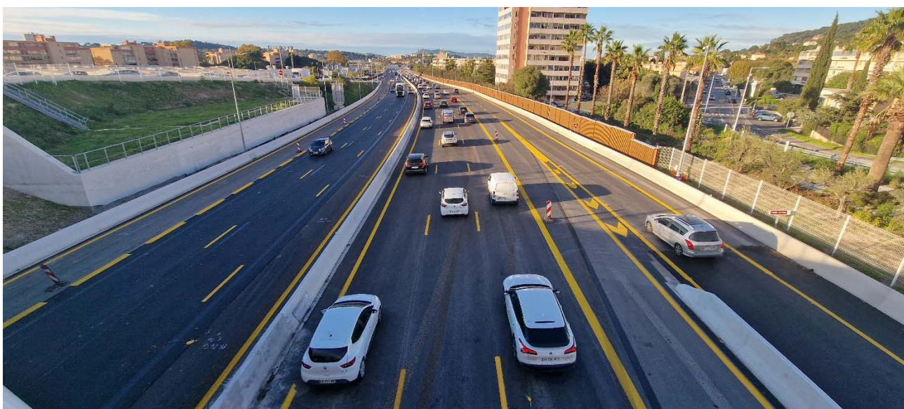
Secteur de La Valette Centre (n°3) / Tombadou

L'aboutissement de cette mise en circulation anticipée et provisoire de la 3 e voie n'aurait pas été possible sans l'appui de l'Etat représenté par le préfet du Var, de ses services, ainsi que des élus locaux.