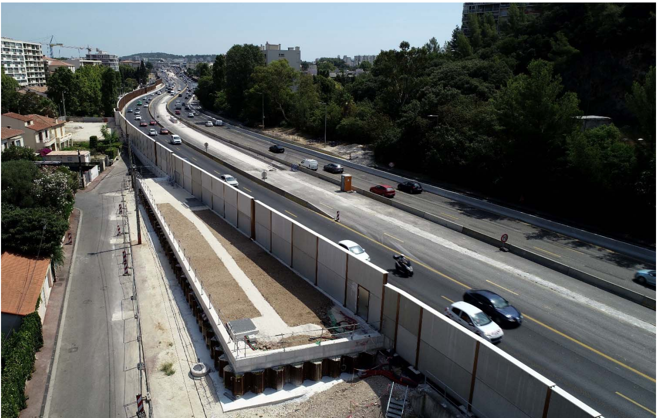
Élargissement A57 – Secteur Saint-Jean du Var : bassin de protection de la ressource en eau enterré © Elite Drone – Juillet 2024

VINCI Autoroutes réalisera des travaux de maintenance sur les équipements du tunnel de Toulon et poursuivra l'élargissement de l'autoroute A57 avec des opérations nuit, la semaine prochaine. Afin de garantir la sécurité des équipes et des usagers, ces interventions nécessiteront des modifications de circulation dans le tunnel de Toulon ainsi que sur l'autoroute A57 à l'Est de la métropole toulonnaise. Pour limiter la gêne au trafic, les opérations auront lieu chaque nuit, entre le lundi 19 août à 21h et le vendredi 23 août à 6h.