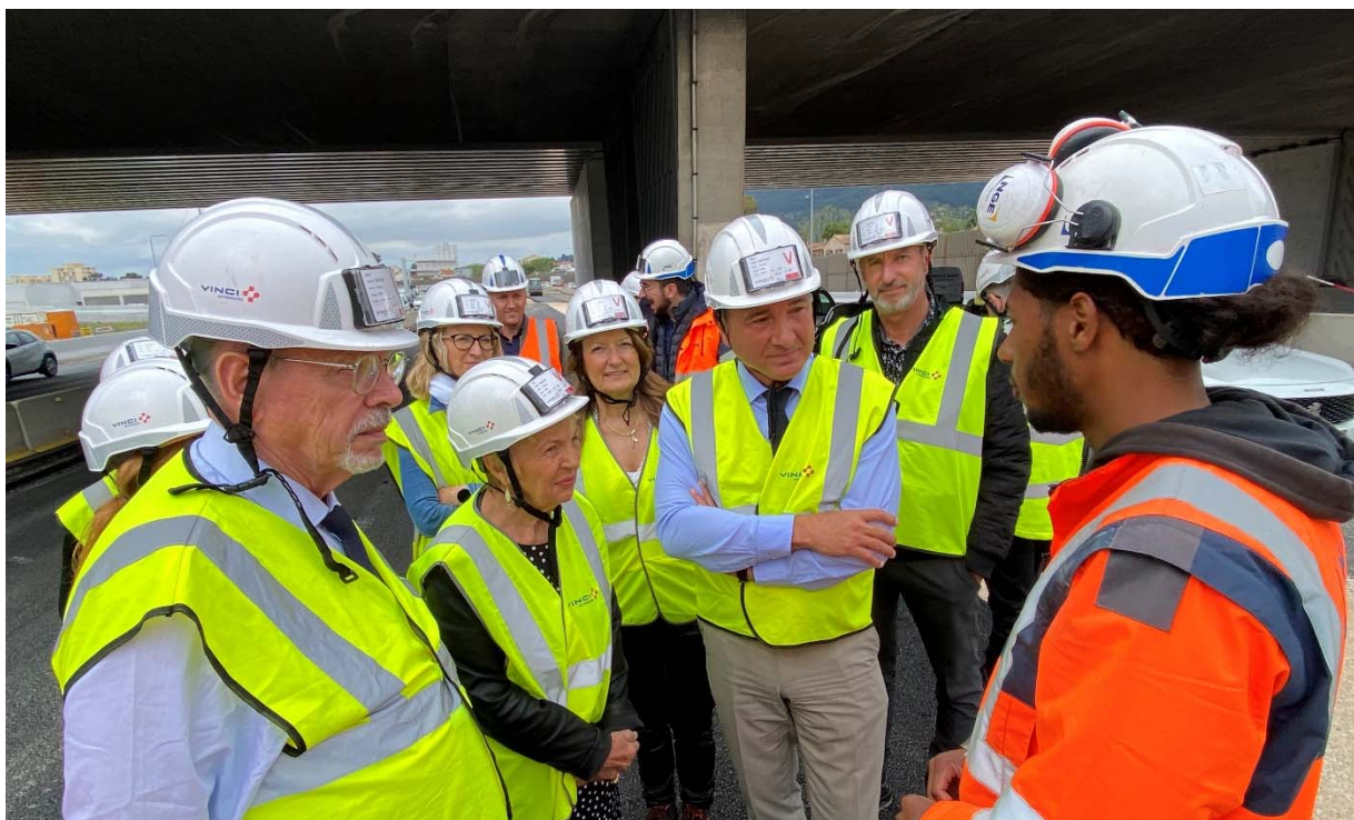
La seconde partie de la rencontre a permis aux acteurs de se rendre sur le chantier pour échanger avec des salariés en insertion.

En 2024, dernière année pleine pour le chantier avant la mise en service de l'élargissement courant 2025, les partenaires entendent poursuivre leur mobilisation pour permettre à des personnes éloignées de l'emploi de retrouver durablement une place dans le monde professionnel.