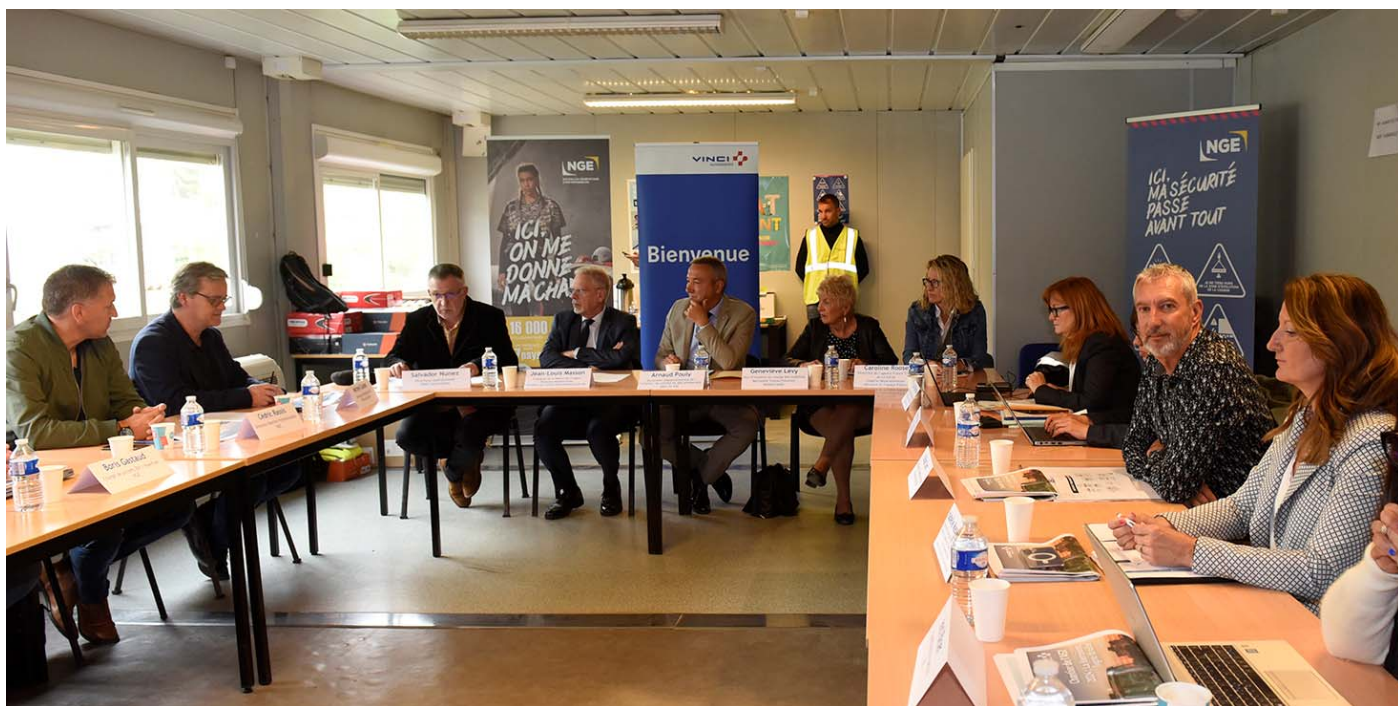
La première partie de la rencontre a été consacrée à la présentation du bilan « insertion A57 » aux membres du comité de pilotage.

L'ensemble des acteurs a pu prendre connaissance du bilan annuel 2023 et au-delà de la progression des résultats depuis le lancement des travaux. Pour mémoire, le nombre d'heures dédié à l'insertion dans la convention était de 67 000 heures. En ce début d'année 2024, le nombre atteignait 126 294 heures d'insertion réalisées.