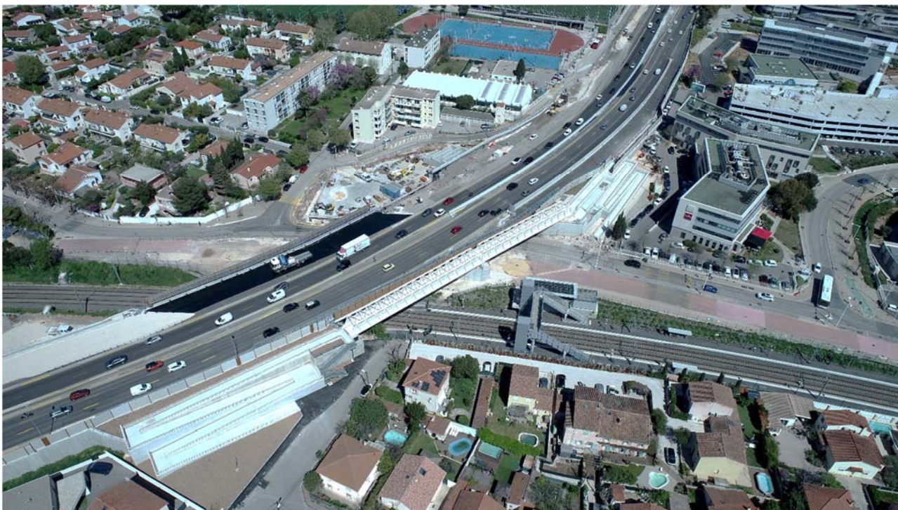
Élargissement à 2x3 voies de l'A57 : dans le secteur de Sainte-Musse, les travaux se poursuivent, côté Nord, avec la création du bassin de protection de la ressource en eau et du futur arrêt de bus.

Depuis plusieurs années, VINCI Autoroutes, maître d'ouvrage reconnu dans de nombreuses opérations d'aménagement du territoire, s'est engagée dans une démarche volontariste en faveur de l'emploi local et de l'insertion en collaboration avec les partenaires locaux, les services de l'Etat et les entreprises qui travaillent pour elle. C'est la raison pour laquelle, VINCI Autoroutes a souhaité s'associer à la Préfecture du Var, aux services de la Direction Départementale de l'Emploi, du Travail et des Solidarités du Var, à France Travail Var, à la Métropole Toulon Provence Méditerranée et à sa Maison de l'Emploi pour collaborer efficacement dans le cadre du chantier d'élargissement de l'autoroute A57 à Toulon.