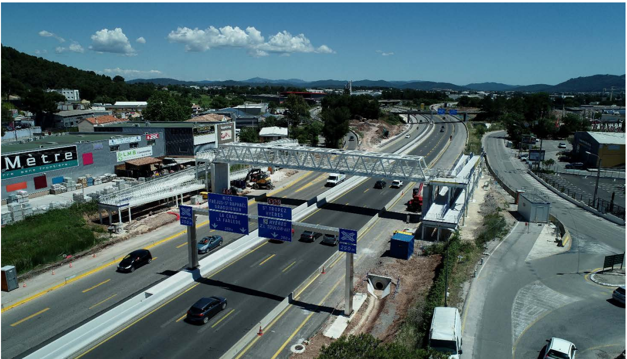
Élargissement A57 – Secteur Pierre Ronde – Aménagements paysagers © Elite Drone - Avril 2024

VINCI Autoroutes réalisera des travaux sur l'autoroute A50, sur les équipements du tunnel de Toulon et poursuivra l'élargissement de l'A57 avec des opérations complexes et techniques de nuit, la semaine prochaine. Afin de garantir la sécurité des équipes et des usagers, ces interventions nécessiteront des modifications de circulation dans le tunnel de Toulon, sur l'A50 et sur l'A57. Pour limiter la gêne au trafic, les opérations auront lieu de nuit, en semaine, du lundi 20 au vendredi 24 mai 2024, entre 21h et 6h.