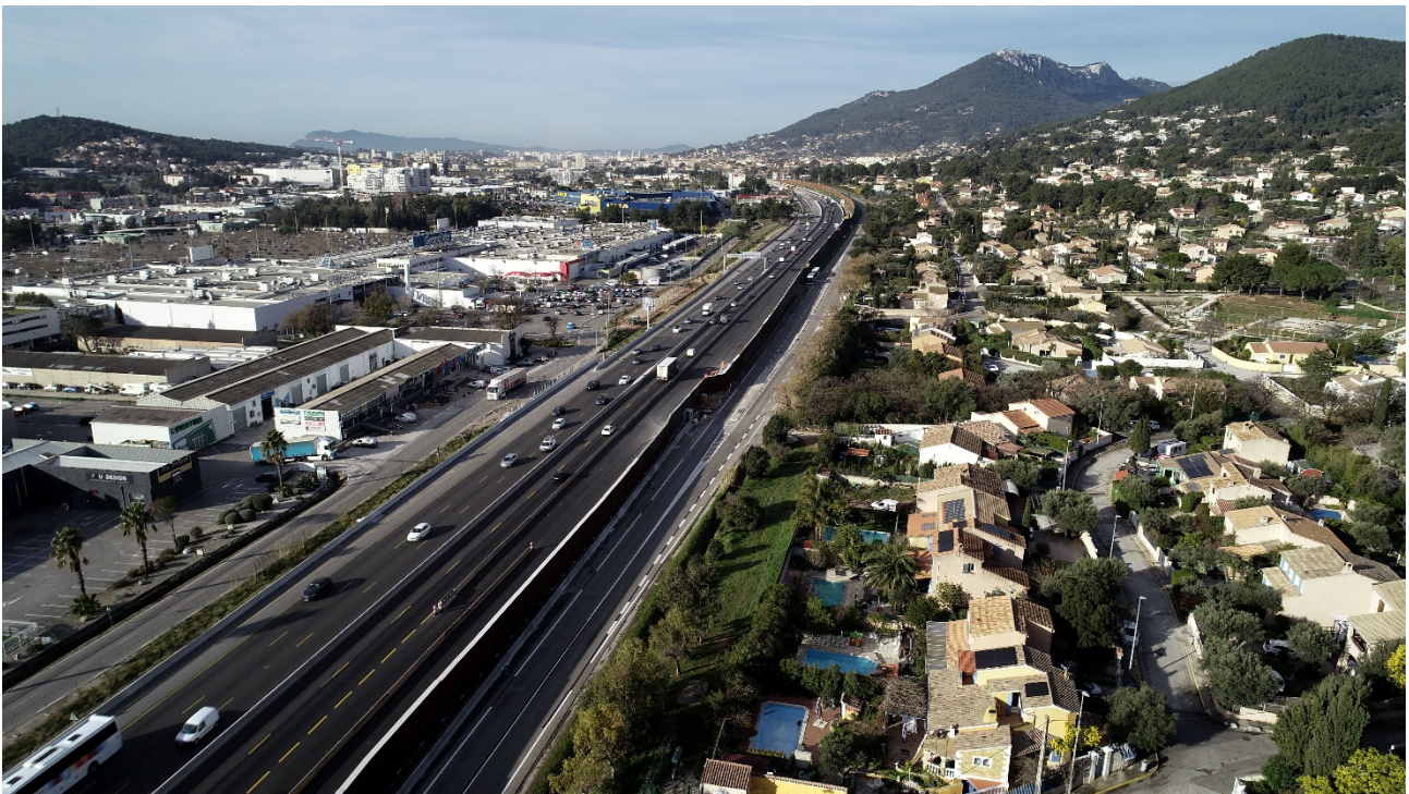
Elargissement A57 – Secteur de La Bigue © Elite drone - Janvier 2024

Afin de garantir la sécurité des équipes et des usagers, ces interventions nécessiteront des modifications de circulation dans le tunnel de Toulon et sur l'A57. Pour limiter la gêne au trafic, les opérations auront lieu de nuit, en semaine, du mardi 2 au vendredi 5 avril 2024, entre 21h et 6h.